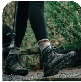
Le CHÂTELARD Podcast conversion écologique