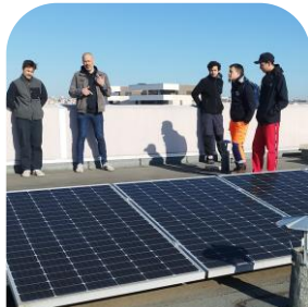
COOPAWATT Energy shakers

www.fondation- amaryservir.org/ projets/