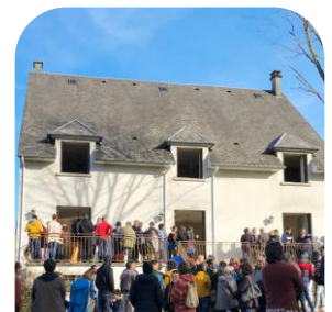
Le MAS, accueil de personnes exilées