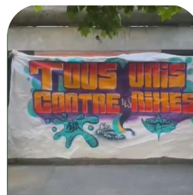
AJA 91 :Terre-Terre Une ferme urbaine à partager