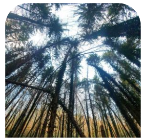
MEDICATION TIME Forêts vivantes