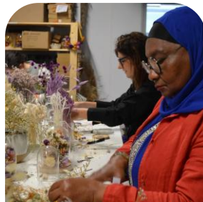
Du Pain & des Roses Rencontres florissantes